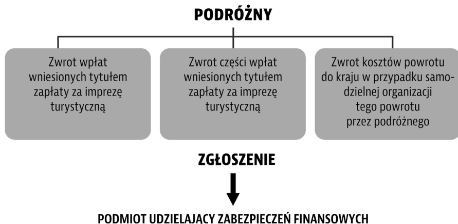
Rys. 4. Zabezpieczenia finansowe na rzecz ochrony podróżnych 31

6) realizować wobec podróżnych obowiązki informacyjne określone w ustawie.