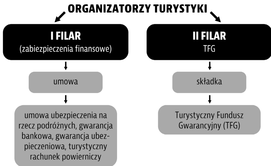
Rys. 2. System zabezpieczeń finansowych w ustawie o imprezach turystycznych i powiązanych usługach turystycznych 13

Fundusz Pomocowy, których rola zostanie omówiona w dalszej części rozważań.