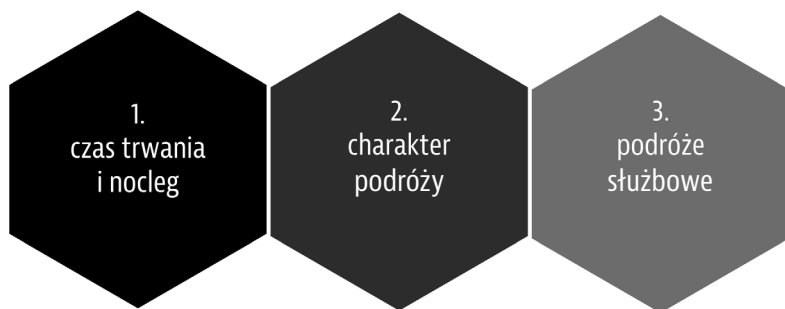
Rys. 1. Wyłączenia z zakresu stosowania ustawy ze względu na: